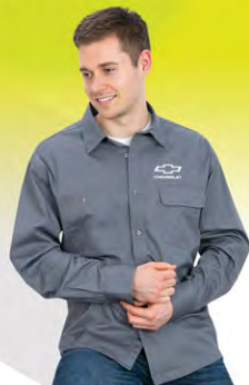
Workforce L/S Shirt | GC02-4643 | S-4XL Chemise Workforce | GC02-4643 | P-4TG