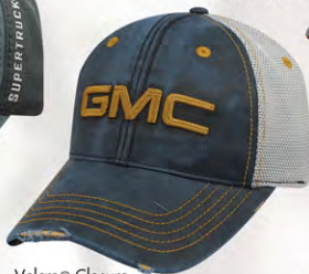
Velcro® Closure GM07-2903 Fermeture velcro