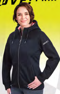
Trail Hybrid Jacket | GM01-4231 | S-2XL Blouson Trail Hybrid | GM01-4231 | P-2TG