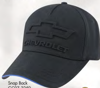
Snap Back GC07-3250 Fermeture à bouton-pression