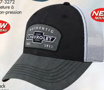
Snap Back GC07-3275 Fermeture à bouton-pression