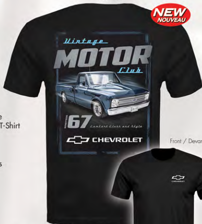
Vintage Motor Club T-shirt manches S/S T-Shirt GC04-2172 Noir | M-3XL