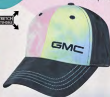
Velcro® Closure GM07-2923 Fermeture velcro