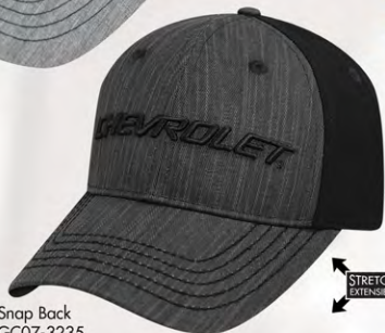
Snap Back GC07-3235 Fermeture à bouton-pression