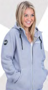
Trail Country Jacket | GM01-4195 | S-L Blouson Trail Country | GM01-4195 | P-G