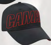
Snap Back GC07-3253 Fermeture à bouton-pression