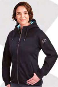
Trail Hybrid Jacket | GC01-4230 | S-2XL Blouson hybride Trail | GC01-4230 | P-2TG