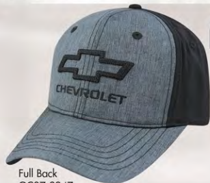
Full Back GC07-3247 Modèle fermé à l'arrière