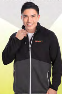
Geared Zip Fleece | GM02-4546 | M-3XL Molleton Geared avec fermeture | GM02-4546 | M-3TG