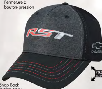
Snap Back GC07-3256 Fermeture à bouton-pression