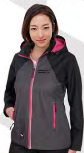
High Speed Jacket | GC01-4069 | S-L, 2XL Blouson High Speed | GC01-4069 | PG, 2TG