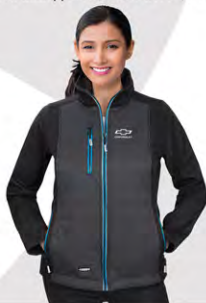
Equalizer Jacket | GC01-4064 | S-2XL Blouson Equalizer | GC01-4064 | P-2TG