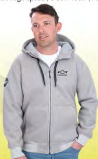
Trail Country Jacket | GC01-4194 | M-3XL Blouson Trail Country | GC01-4194 | M-3TG