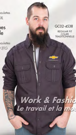
GC02-4538 REGULAR FIT COUPE TRADITIONNELLE