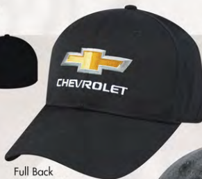
Full Back GC07-3249 Modèle fermé à l'arrière