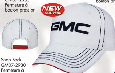
Snap Back GM07-2930 Fermeture à bouton-pression