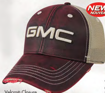
Velcro® Closure GM07-2936 Fermeture velcro