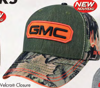
Velcro® Closure GM07-2934 Fermeture velcro