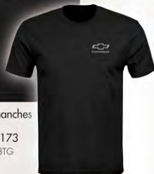
Front / Devant