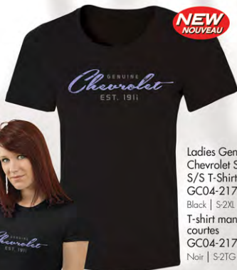
Ladies Genuine Chevrolet S/S T-Shirt S/S T-Shirt GC04-2171 Black | S-2XL T-shirt manches courtes GC04-2171 Noir | S-2TG