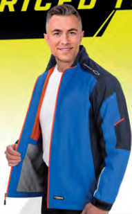
Intensity Jacket | GC01-3979 | S-XL, 3XL Blouson Intensity | GC01-3979 | PTG, 3TG