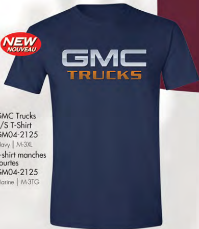
GMC Trucks S/S T-Shirt GM04-2125 Navy | M-3XL T-shirt manches courtes GM04-2125 Marine | M-3TG