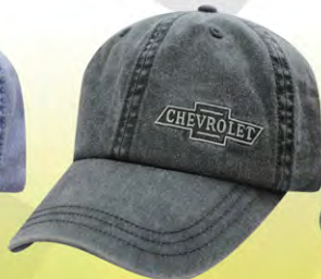
Buckle Closure | GC07-3211 Fermeture boucle