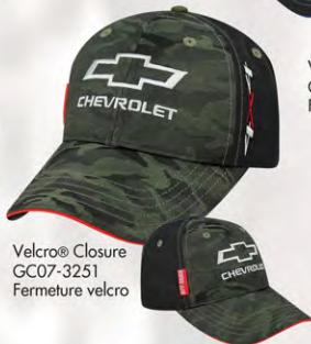
Velcro® Closure GC07-3251 Fermeture velcro