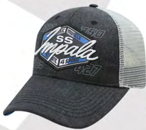
Snap Back | GC07-3189 Fermeture à bouton-pression