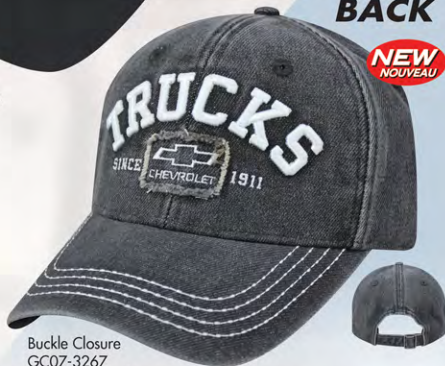
Buckle Closure GC07-3267 Fermeture boucle