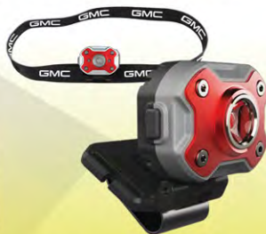
Rechargeable Headlamp w/ Headband | GM09-3407 Lampe Frontale Rechargeable GM09-3407