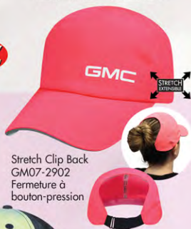
Stretch Clip Back GM07-2902 Fermeture à bouton-pression