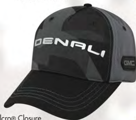
Velcro® Closure GM07-2918 Fermeture velcro