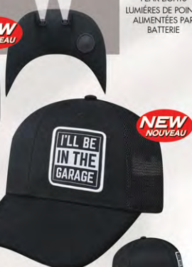
Snap Back GM07-2932 Fermeture à bouton-pression