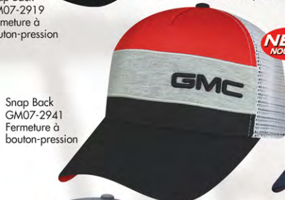
Snap Back GM07-2941 Fermeture à bouton-pression