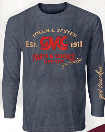
GMC Tough & Tested L/S T-Shirt GM02-4855 | Heather Navy | S-3XL T-shirts manches longues GMC Tough & Tested GM02-4855 | Bleu marine chiné | P-3TG