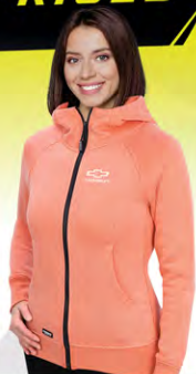
Shifter Fleece | GC02-4446 | S-XL Molleton Shifter | GC02-4446 | P-TG