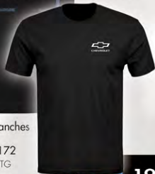
Front / Devant