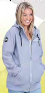
Trail Country Jacket | GC01-4195 | S-L Blousance Trail Country | GC01-4195 | PG