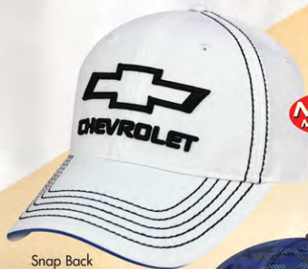
Snap Back GC07-3266 Fermeture à bouton-pression