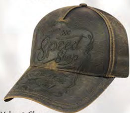
Velcro® Closure GC07-3261 Fermeture velcro