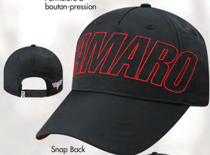
Snap Back GC07-3264 Fermeture à bouton-pression