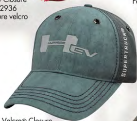
Velcro® Closure GM07-2834 Fermeture velcro