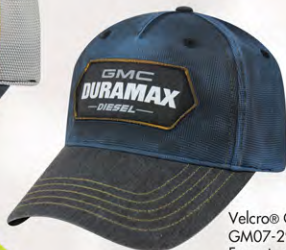
Velcro® Closure GM07-2917 Fermeture velcro