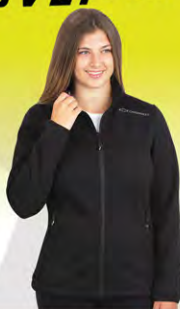
Ladies Unstoppable Jacket | GC01-3945 | L-2XL Blouson Unstoppable | GC01-3945 | G-2TG