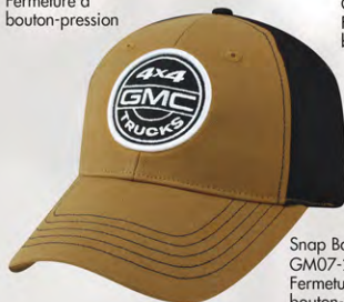
Snap Back GM07-2928 Fermeture à bouton-pression