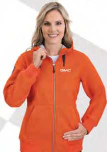
Trail Country Jacket | GM01-4136 | S-2XL Blouson Trail Country | GM01-4136 | P-2TG