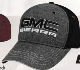
Full Back GM07-2904 Modèle fermé à l'arrière