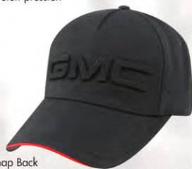
Snap Back GM07-2920 Fermeture à bouton-pression