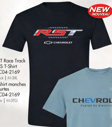
RST Race Track S/S T-Shirt GC04-2169 Black | M-3XL T-shirt manches courtes GC04-2169 Noir | M-3TG