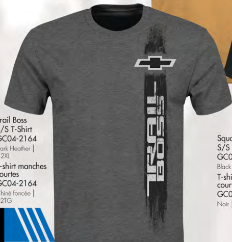
Trail Boss S/S T-Shirt GC04-2164 Dark Heather | S-2XL T-shirt manches courtes GC04-2164 Chiné foncée | P-2TG