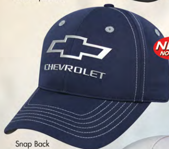
Snap Back GC07-3277 Fermeture à bouton-pression