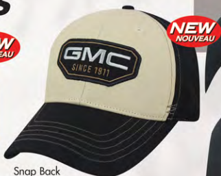
Snap Back GM07-2937 Fermeture à bouton-pression