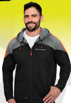
Invigorator Fleece | GC02-4424 | S-3XL Molleton Invigorator | GC02-4424 | P-3TG