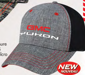
Velcro® Closure GM07-2945 Fermeture velcro