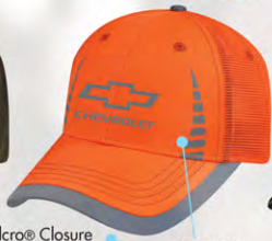
Velcro® Closure GC07-3240 Fermeture velcro