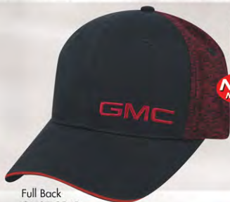
Full Back GM07-2940 Modèle fermé à l'arrière