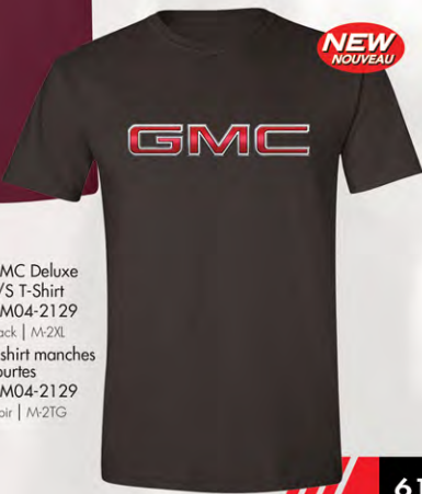
GMC Deluxe S/S T-Shirt GM04-2129 Black | M-2XL T-shirt manches courtes GM04-2129 Noir | M-2TG