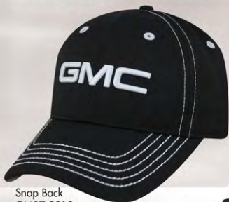
Snap Back GM07-2919 Fermeture à bouton-pression

VOLUME DISCOUNT PRICING! PRIX DE REMISE SUR VOLUME!