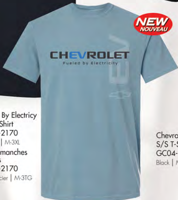
Fueled By Electricity S/S T-Shirt GC04-2170 Ice Blue | M-3XL T-shirt manches courtes GC04-2170 Bleu glacier | M-3TG