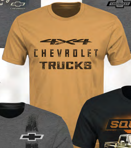
4x4 Chevrolet S/S T-Shirt GC04-2162 Tough Tan | S-3XL T-shirt manches courtes GC04-2162 Tan | P-3TG