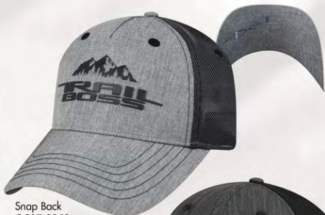
Snap Back GC07-3259 Fermeture à bouton-pression