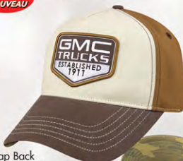
Snap Back GM07-2924 Fermeture à bouton-pression