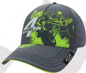
Velcro® Closure | GC07-3160 Fermeture velcro®