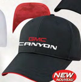
Snap Back GM07-2947 Fermeture à bouton-pression