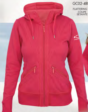
GC02-4880 FLATTERING FIT COUPE SÉYANTE