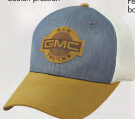
Snap Back GM07-2911 Fermeture à bouton-pression