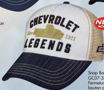
Snap Back GC07-3279 Fermeture à bouton-pression