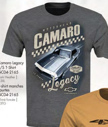
Camaro Legacy S/S T-Shirt GC04-2165 Dark Heather | S-3XL T-shirt manches courtes GC04-2165 Chiné foncée | P-3TG