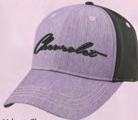
Velcro® Closure GC07-3257 Fermeture velcro