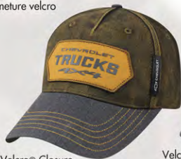
Velcro® Closure GC07-3248 Fermeture velcro