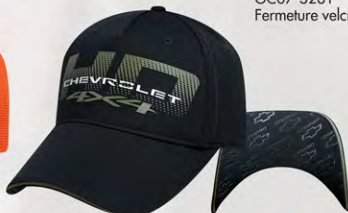
Velcro® Closure GC07-3230 Fermeture velcro