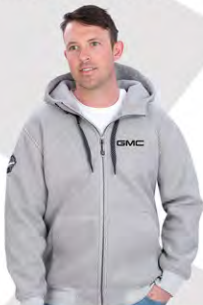
Trail Country Jacket | GM01-4194 | M-3XL Blouson Trail Country | GM01-4194 | M-3TG