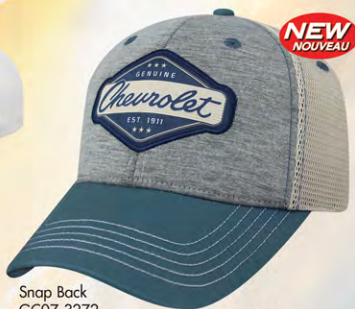
Snap Back GC07-3272 Fermeture à bouton-pression