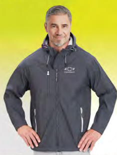
Endurance Jacket | GC01-4324 | S-3XL Blouson Endurance | GC01-4324 | P-3TG