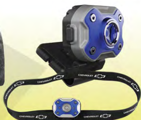
Rechargeable Headlamp w/ Headband | GC09-3406 Lampe Frontale Rechargeable GC09-3406