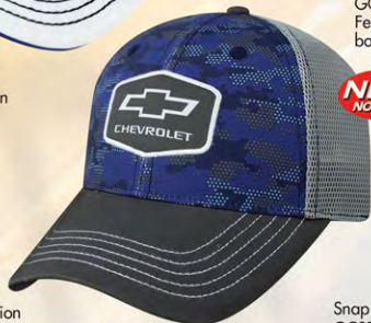
Snap Back GC07-3271 Fermeture à bouton-pression