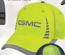
Velcro® Closure GM07-2906 Fermeture velcro