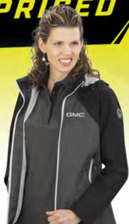
Rev'd Up Jacket | GM01-3909 | S-2XL Blouson Rev'd Up | GM01-3909 | P-2TG