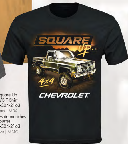
Square Up S/S T-Shirt GC04-2163 Black | M-3XL T-shirt manches courtes GC04-2163 Noir | M-3TG