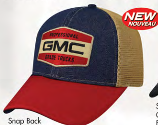
Snap Back GM07-2933 Fermeture à bouton-pression

BATTERY POWERED PEAK LIGHTS LUMIÈRES DE POINTE ALIMENTÉES PAR BATTERIE