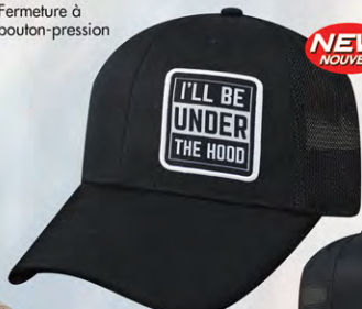
Snap Back GC07-3278 Fermeture à bouton-pression