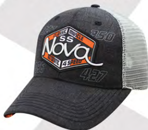
Snap Back | GC07-3187 Fermeture à bouton-pression