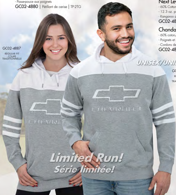
GC02-4887 REGULAR FIT COUPE TRADITIONNELLE

- 60% coton/40% polyester - Molleton brossé pré-rétréci 12,3 oz. - Poignets et ceinture côtelés - Poche kangourou - Cardons de serrage épais et résistants GC02-4889 | Noir/Anthracite | P.3TG