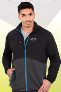
Geared Zip Fleece | GC02-4547 | M-3XL Molleton Geared avec fermeture | GC02-4547 | M-3TG