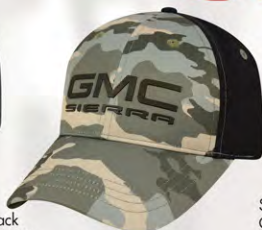
Snap Back GM07-2922 Fermeture à bouton-pression