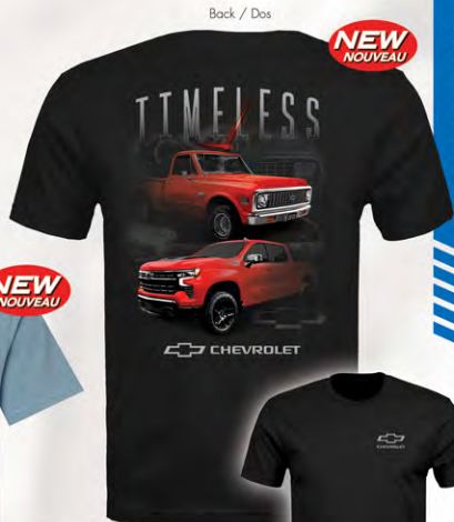
Chevrolet Timeless T-shirt manches S/S T-Shirt GC04-2173 Black | M-3XL