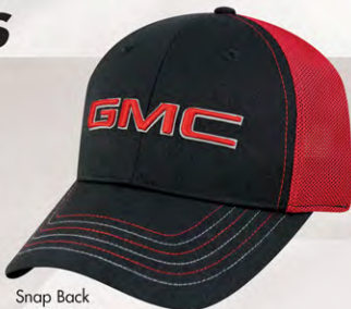
Snap Back GM07-2921 Fermeture à bouton-pression