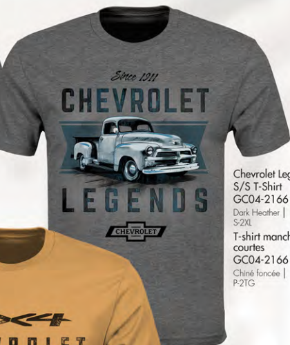
Chevrolet Legends S/S T-Shirt GC04-2166 Dark Heather | S-2XL T-shirt manches courtes GC04-2166 Chiné foncée | P-2TG