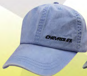
Buckle Closure | GC07-3210 Fermeture boucle