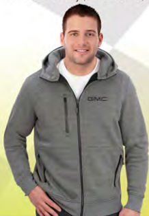
Shifter Fleece | GM02-4678 | S-3XL Molleton Shifter | GM02-4678 | P-3TG