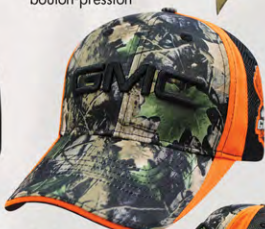
Snap Back GM07-2927 Fermeture à bouton-pression