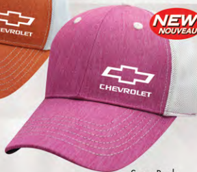
Snap Back GC07-3273 Fermeture à bouton-pression