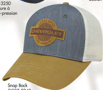
Snap Back GC07-3243 Fermeture à bouton-pression