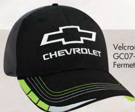
Velcro® Closure GC07-5514 Fermeture velcro