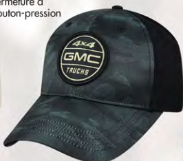
Snap Back GM07-2869 Fermeture à bouton-pression