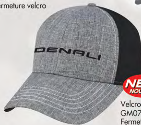
Velcro® Closure GM07-2949 Fermeture velcro