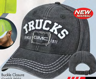
Buckle Closure GM07-2931 Fermeture boucle